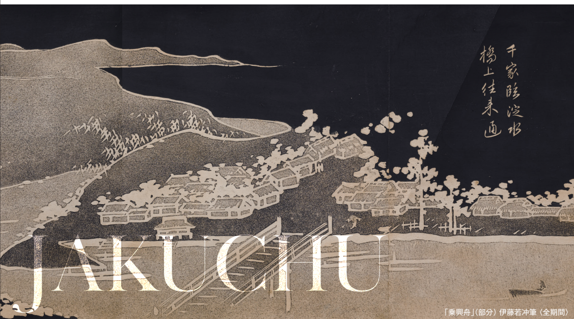
「乗興舟」(部分) 伊藤若冲筆 (全期間)