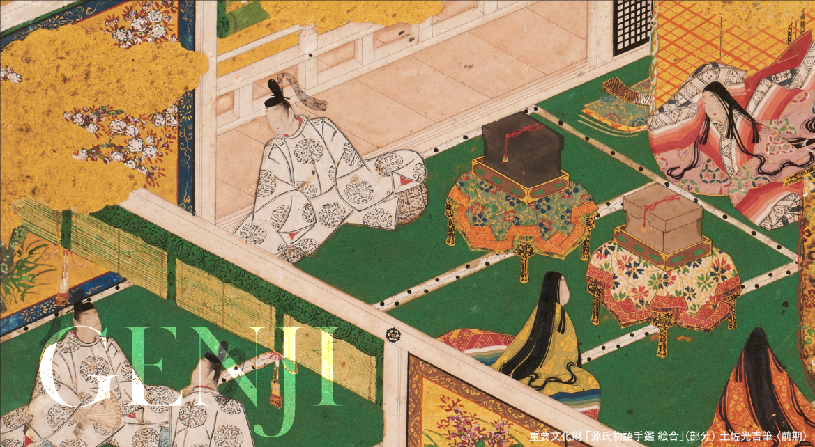
重要文化財「源氏物語手鑑 絵巻」(部分) 土佐光吉筆 (前期)