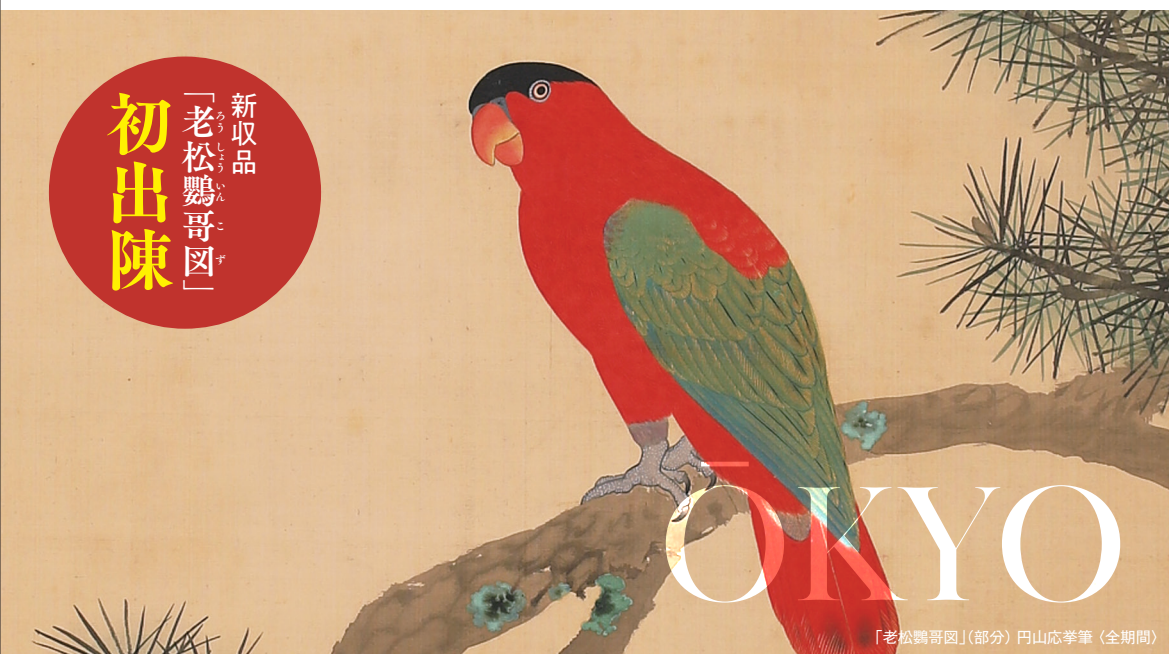
「老松鸚哥図」(部分) 円山応挙筆 (全期間)