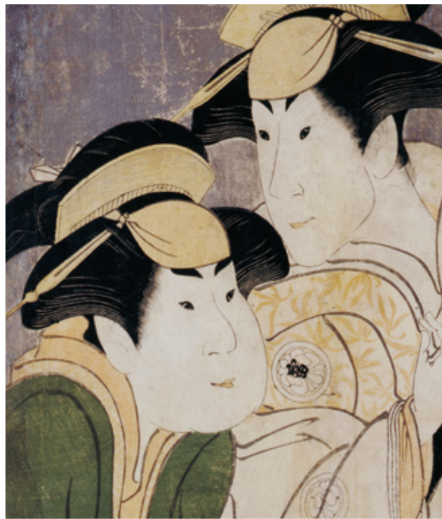
東洲斎写楽 二世瀬川富三郎の岸蔵人妻やどり木と中村万世の腰元若草 和泉市久保惣記念美術館蔵

主催：和泉市 和泉市教育委員会 一般財団法人和泉市文化振興財団 和泉市久保惣記念美術館 協賛：泉北高速鉄道株式会社 トヨタ久保グループ 助成：公益財団法人三菱UFJ信託地域文化財団 芸術文化振興基金助成事業 関西元氣文化圏参加事業