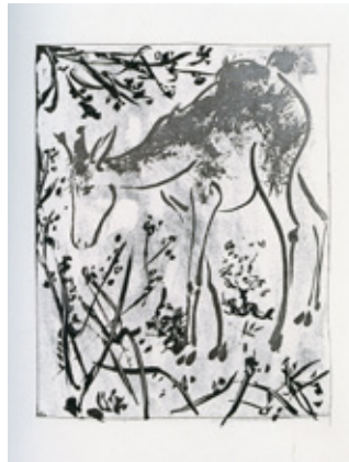
パブロ・ピカソ ビュフォン「博物誌」より「鹿」 1936年(1942年刊行) 国立西洋美術館蔵