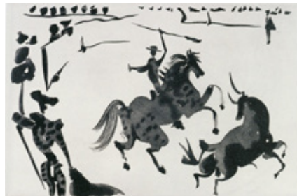
パブロ・ピカソ 「闘牛技」より「牡牛を槍で突く」1957年 群馬県立館林美術館蔵 (会期中展示替えあり)