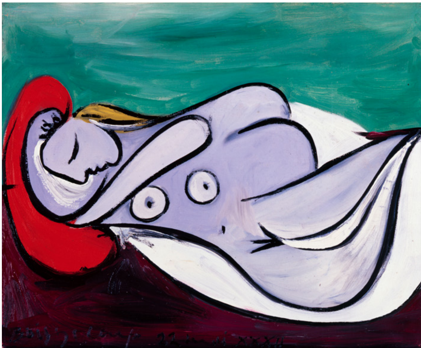
パブロ・ピカソ 赤い枕で眠る女 1932年 徳島県立近代美術館蔵