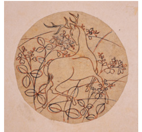
重要文化財 尾形光琳 円型図案集 江戸時代 大阪市立美術館蔵 (会期中場面替えあり)