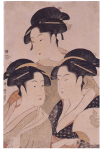
喜多川歌麿 当時美人 江戸時代 和泉市久保惣記念美術館蔵