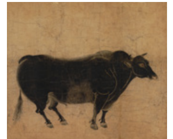
重要文化財 駿牛図 鎌倉時代 文化庁蔵 (後期展示)