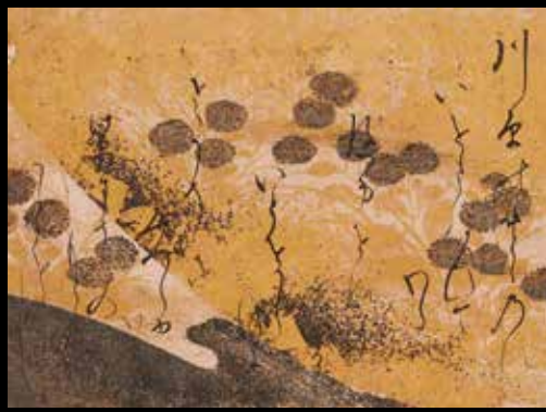
(詞書・持明院基久)